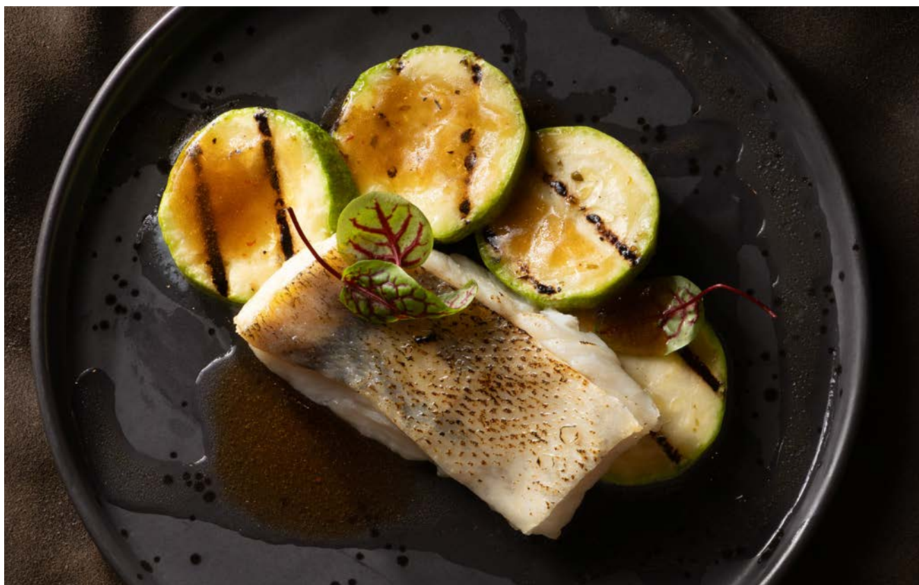
СУДАК ГРИЛЬ С ЦУКИНИ 260 г с лимонной эмульсией и травами