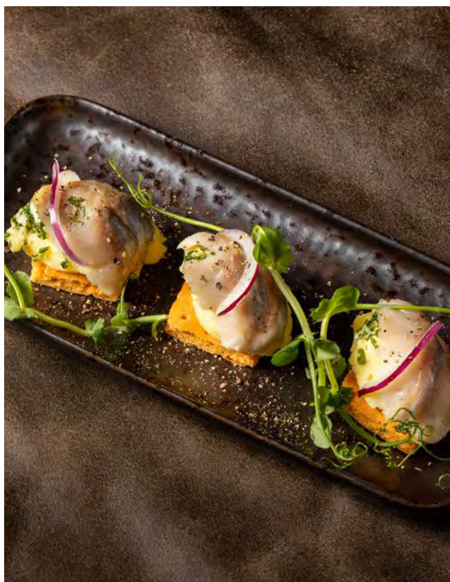
КАРТОФЕЛЬ С СЕЛЬДЬЮ 120 г на солодовой коврижке