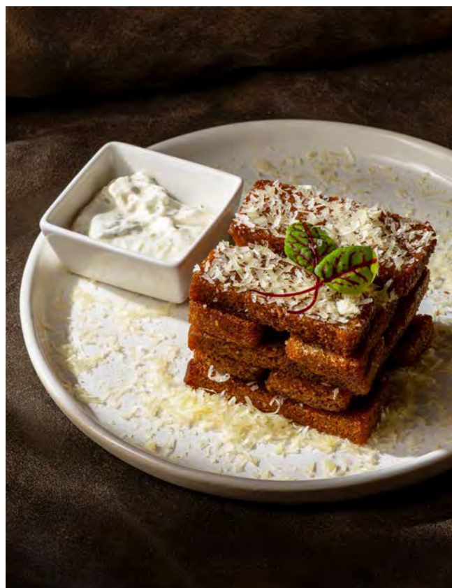
ГРЕНКИ С ПАРМЕЗАНОМ 120 г