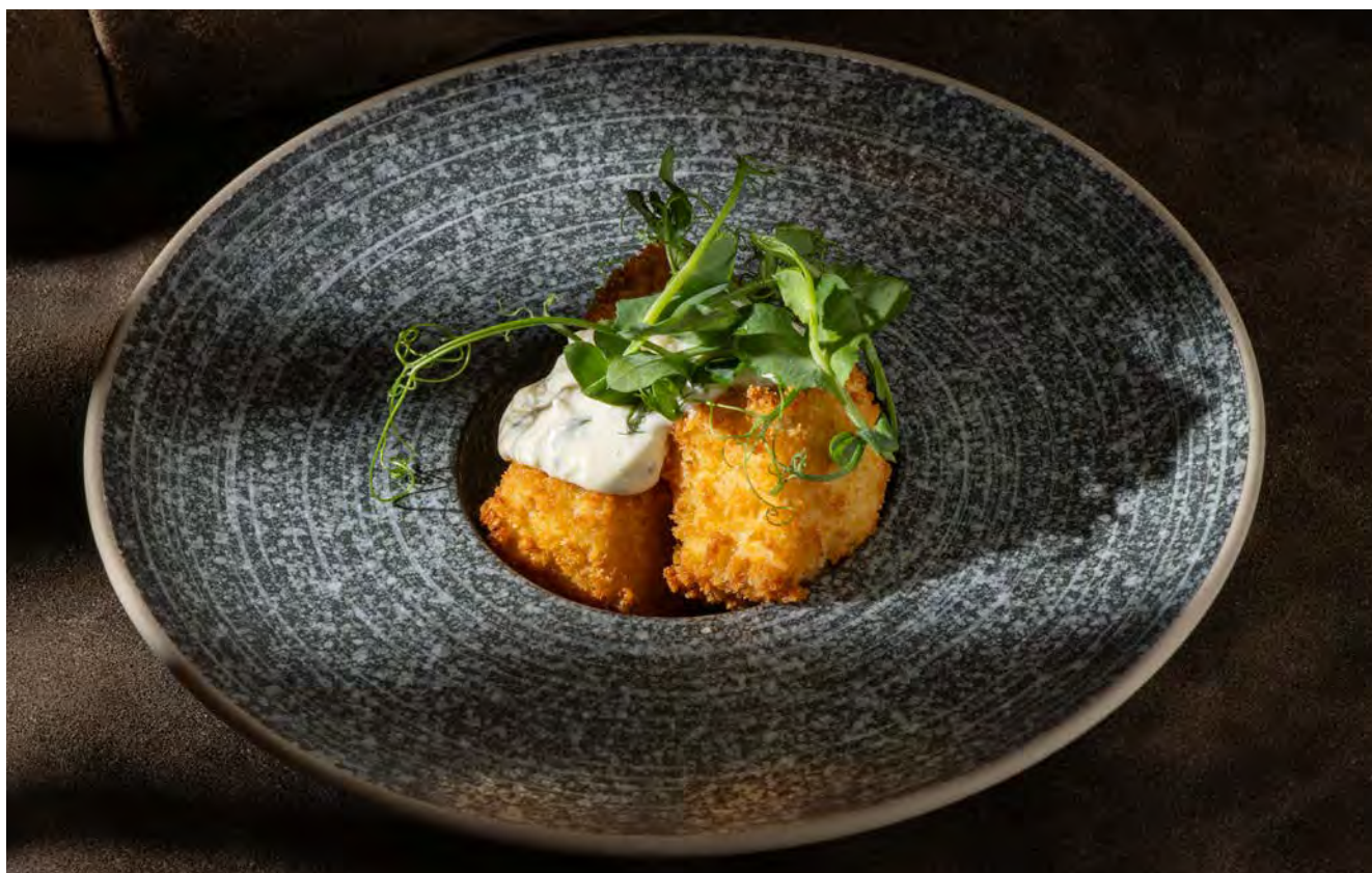
КУРИНЫЙ ПОПКОРН 110 г