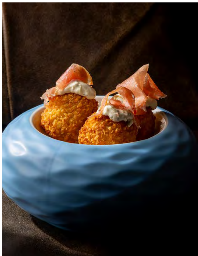
КРОКЕТЫ С ПРОШУТТО 120 г и сыром манчего