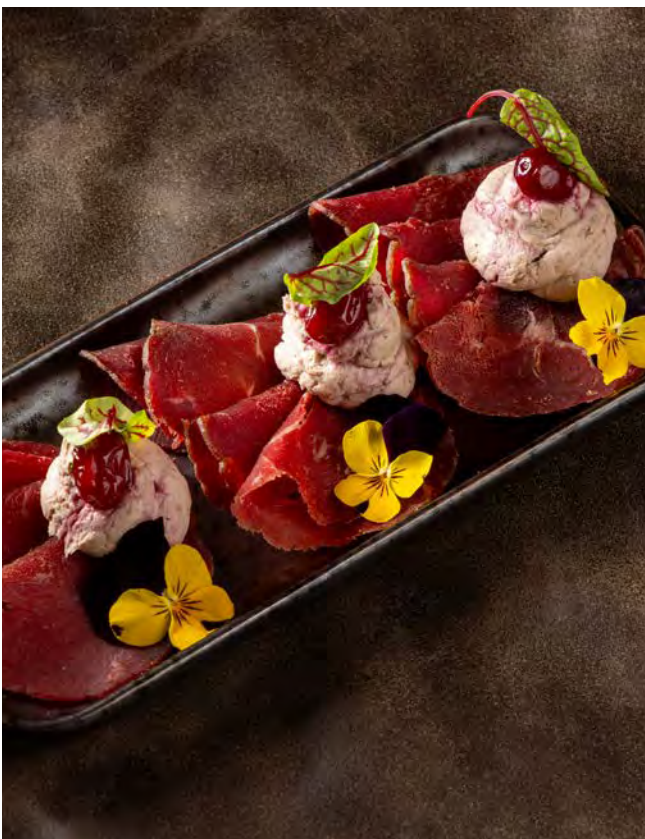
БРЕЗАОЛА С КРЕМОМ 180 г 1 800 из вяленой оленины и маринованной клюквы