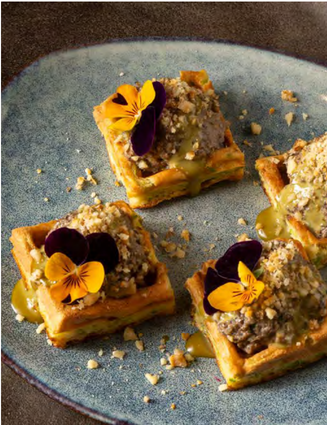
ВАФЛЯ С ГРИБНЫМ ПАШТЕТОМ 810 и фисташкой 120 г