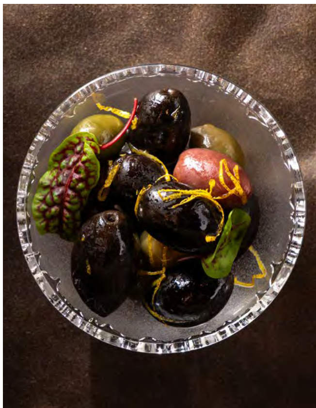
ОЛИВКИ С ЦЕДРОЙ 70 г