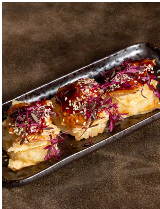
МИЛФЕЙ С УГРЕМ 120 г и карамельным яблоком