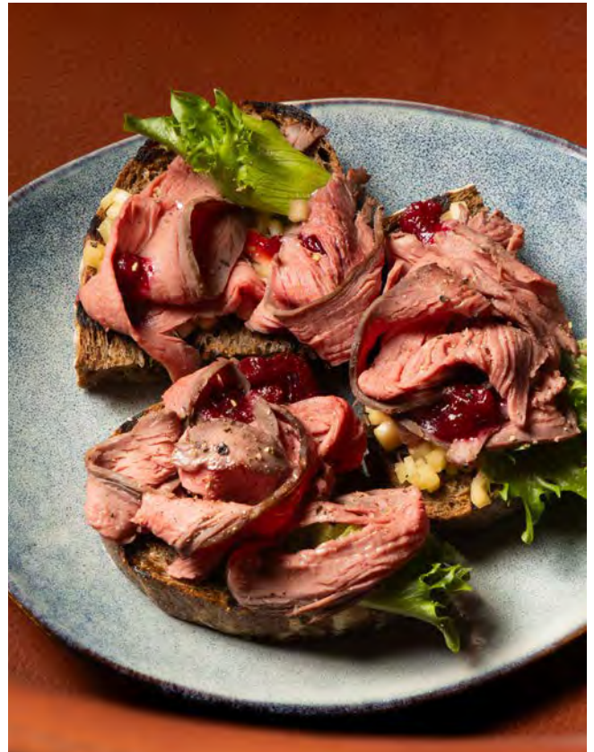
БРУСКЕТТА С РОСТБИФОМ 120 г 830 манго и копченой брусникой