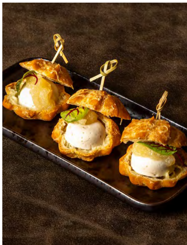
ТРЮФЕЛЬНОЕ ШУ 90 г с куриным муссом