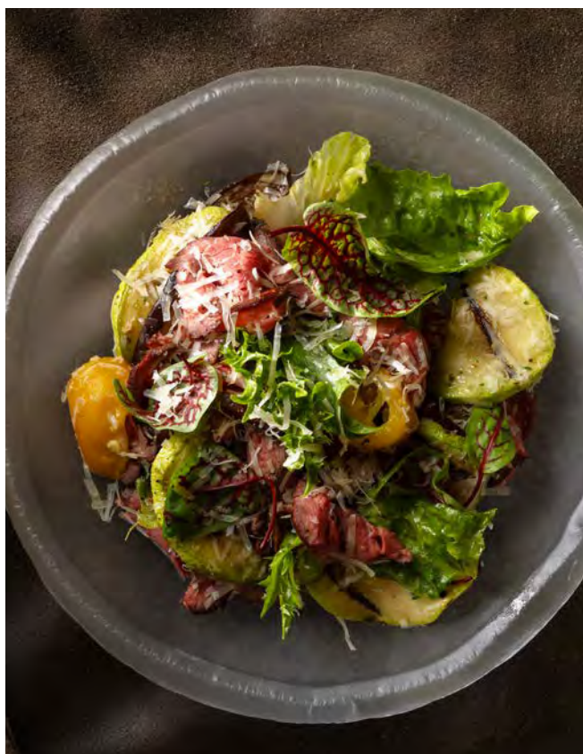
САЛАТ С РОСТБИФОМ 160 г и печеными овощами