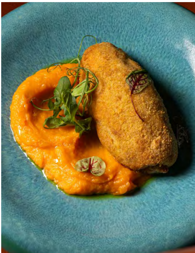
КИЕВСКАЯ КОТЛЕТА 290 г 850 с кремом из батата