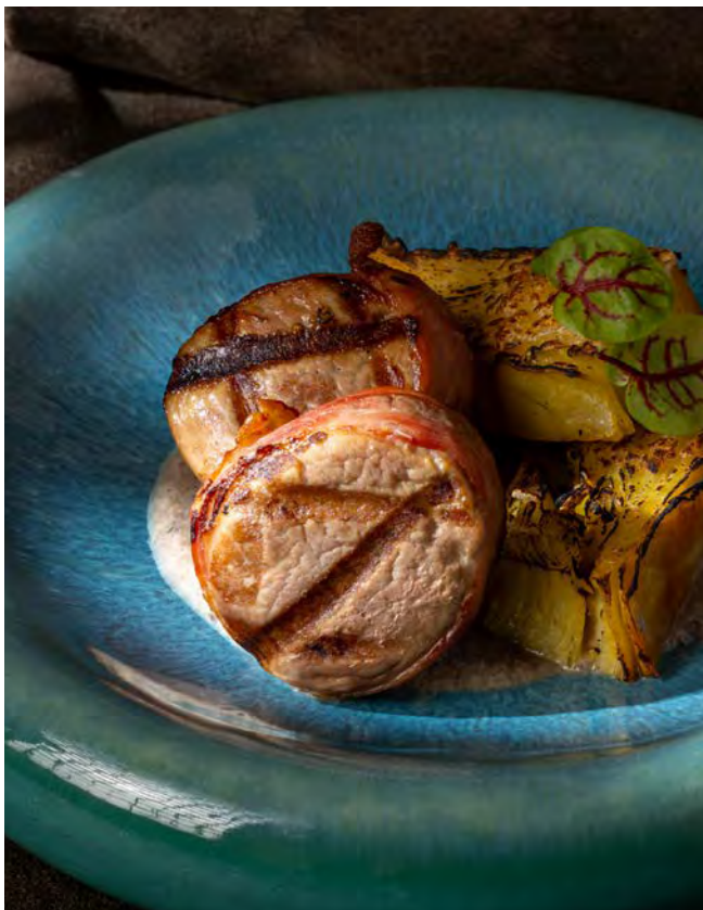
МЕДАЛЬОНЫ ИЗ ПОРОСЕНКА 860 с гратеном и грибным соусом 260 г