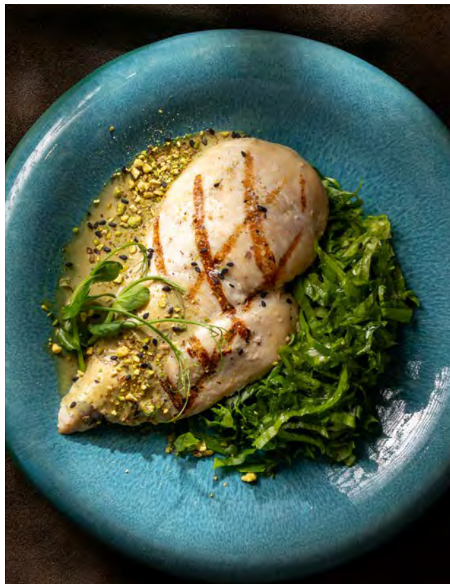
ГРУДКА ЦЫПЛЕНКА 180 г 690 с фисташковым соусом и микс-салатом