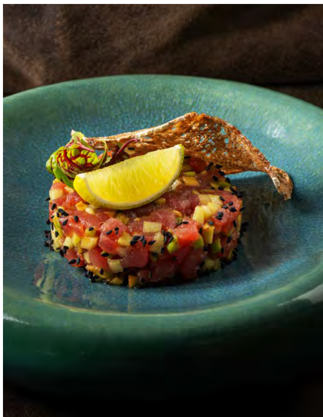
ТАР-ТАР ИЗ ТУНЦА 150 г