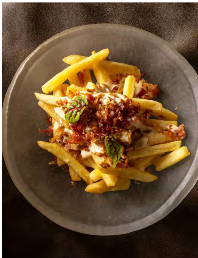
КАРТОФЕЛЬ ФРИ 200 г «Сыр и бекон»