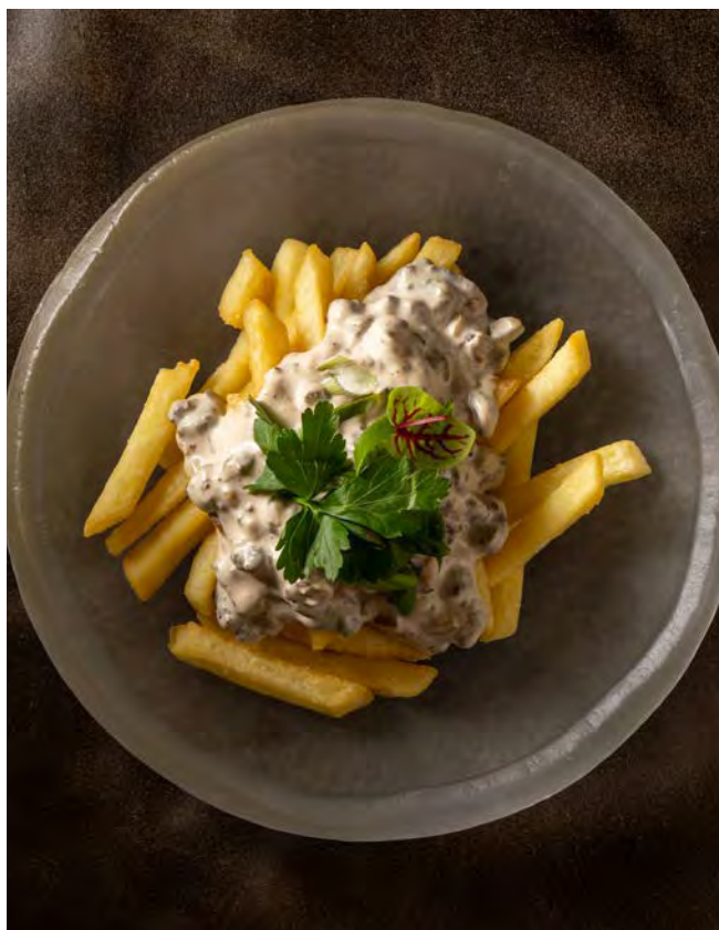
КАРТОФЕЛЬ ФРИ 200 г «Бефстроганов»