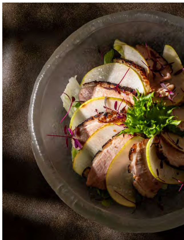
ТЁПЛЫЙ САЛАТ 160 г с утиной грудкой конфи и грушей