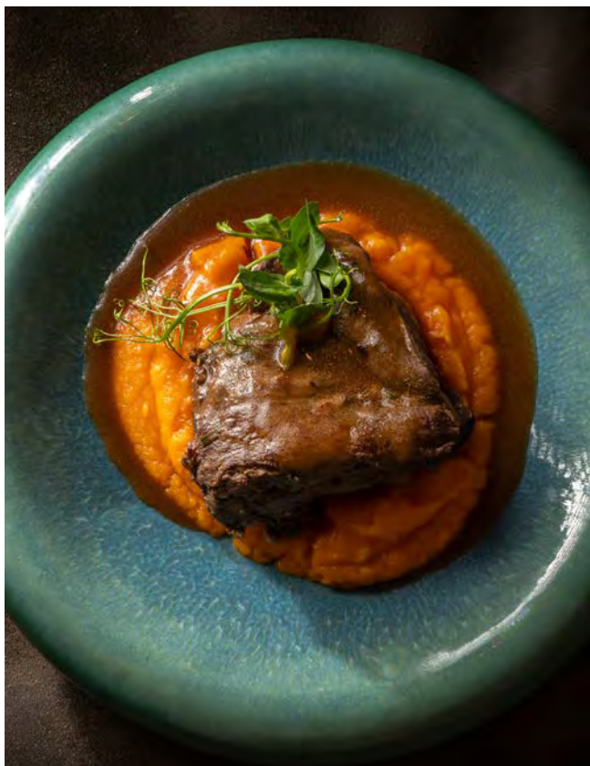
ЩЕКА ТЕЛЕНКА 250 г 1 290 с пряным кремом и соусом демиглас