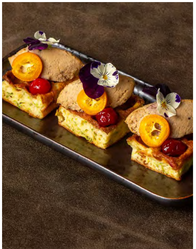
ПАТЕ ИЗ ИНДЕЙКИ 120 г 580 на вафле с вяленой клюквой и кумкватом