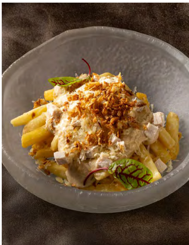
КАРТОФЕЛЬ ФРИ 200 г «Цезарь и лук фри»