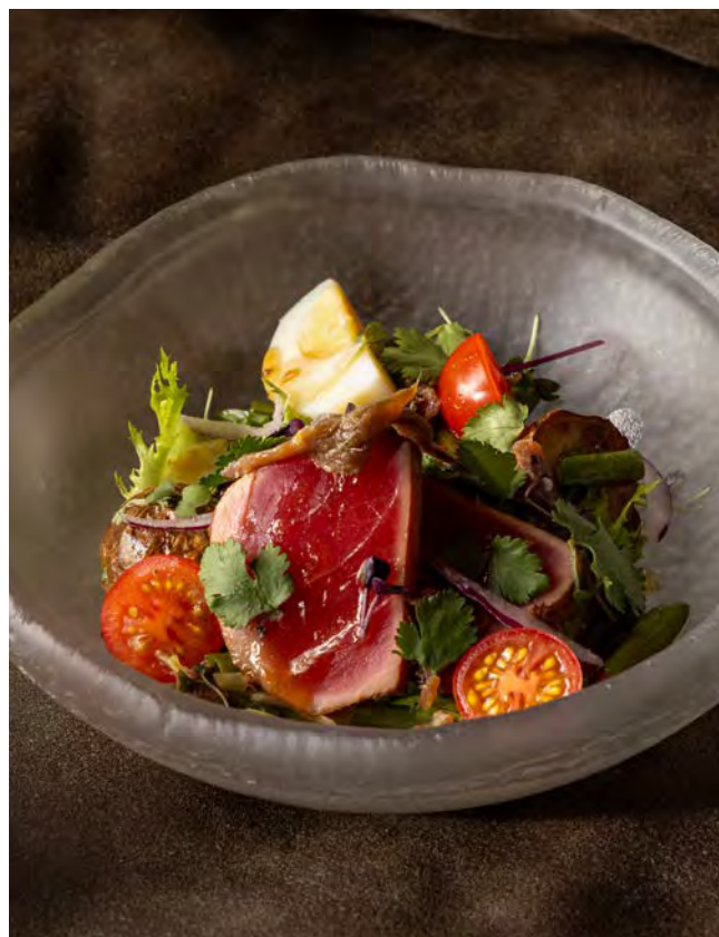
НИСУАЗ 160 г с тунцом конфи