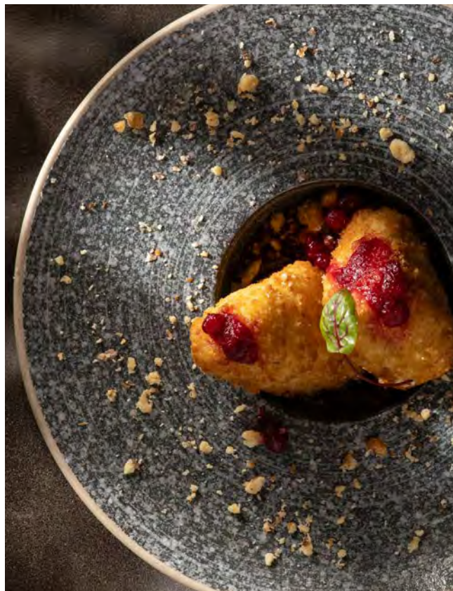
СУЛУГУНИ ФРИ 110 г