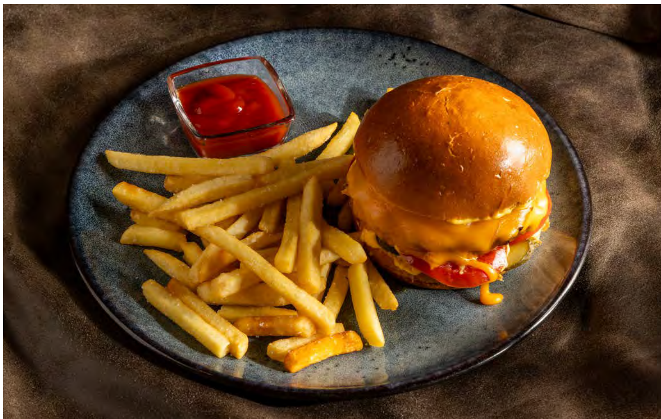
БУРГЕР С ТРОЙНЫМ СЫРОМ 350 г и картофелем фри